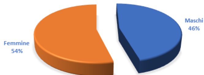
DISTRIBUZIONE PER SESSO DEI DIPENDENTI

Analizzando in dettaglio i dati per anzianità anagrafica, si osserva che l'età media dei dipendenti è abbastanza elevata.