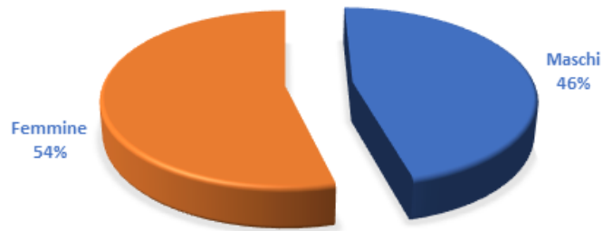
DISTRIBUZIONE PER SESSO DEI DIPENDENTI

Analizzando in dettaglio i dati per anzianità anagrafica, si osserva che l'età media dei dipendenti è abbastanza elevata.